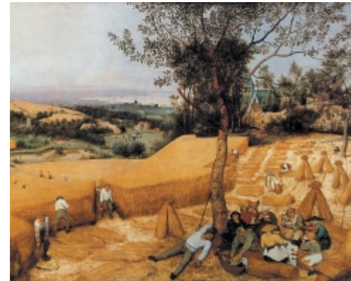
Pieter Bruegel: Los segadores (1565). óleo sobre Madera, 118,1 x 160,7 cm. Metropolitan Museum of Art, Nueva York.

nera, Buenos Aires, 2004). Es la prosa poética, es la poesía que da lo mismo que esté escrita en columna de verso o no. Está escrita como en versículo. Ahí se traduce su manía autodestructiva de una manera tremenda. Lihn escribe una poesía que es como escéptica de sí misma.