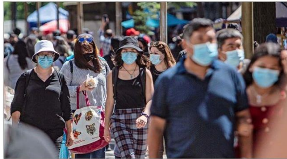
La mayoría de las personas (sobre un 60%) percibe su realidad económica y familiar actual como mejor a la que tuvieron sus padres y que esta podría mejorar en la próxima década.

Recuerda, además, que el IFE ha sido una inversión gigante que se ha hecho como país. "Pero la gente es bastante sensata y se da cuenta de que esas transfe-