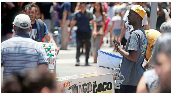
TENSIÓN CON FORÁNEOS. — La edición 2023 refleja la percepción de la opinión pública sobre el impacto del fenómeno migratorio que vive Chile en los últimos años.